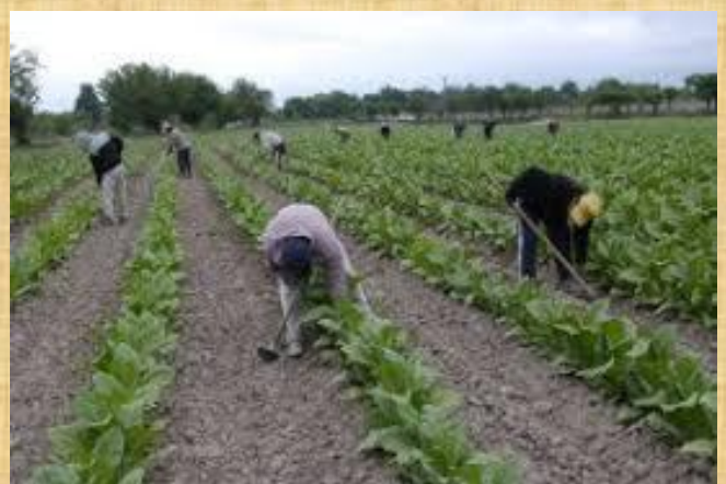
Cultivo del tabaco