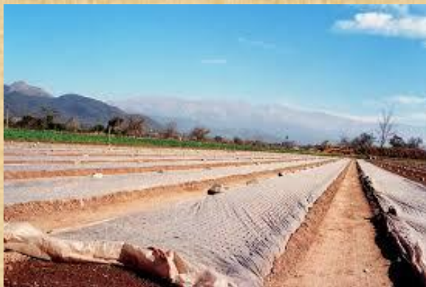
Almácigos de tabaco