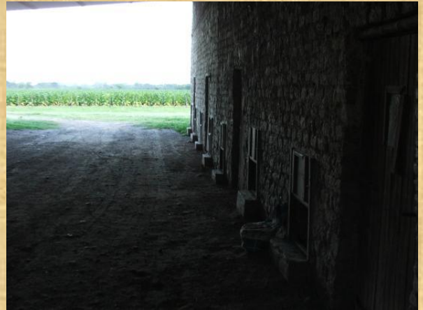
Estufas a leña para el secado del tabaco