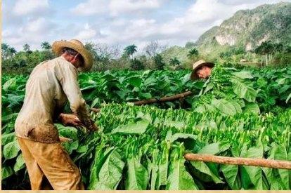
Encañado del tabaco para su secado