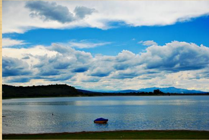
Dique La Ciénaga