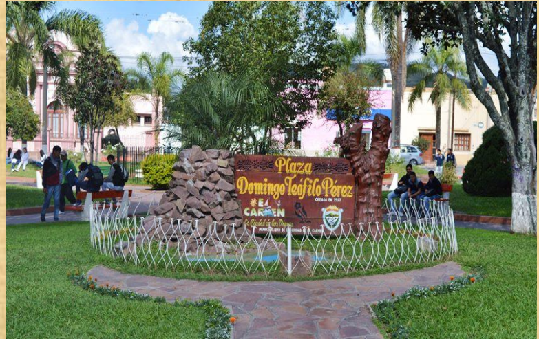
Plaza Domingo Teófilo Pérez - El Carmen