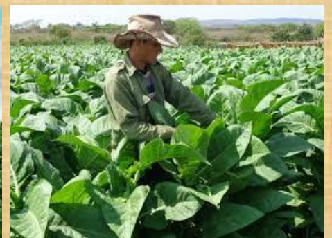
Plantaciones de Tabaco