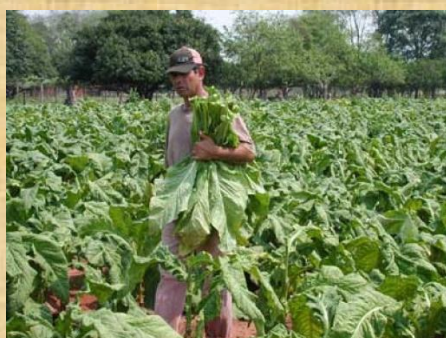
Cosecha hojas de Tabaco