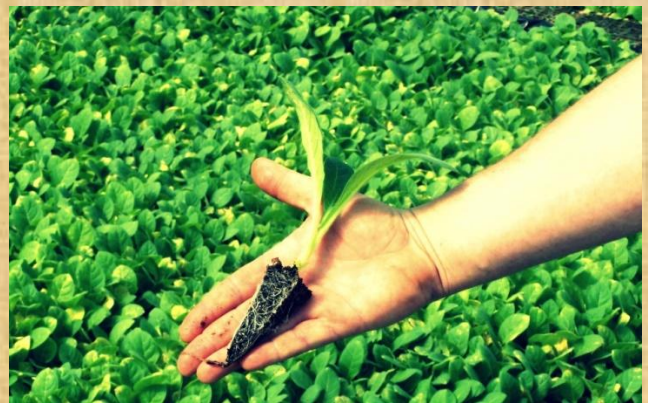
Almácigo listo para su trasplante