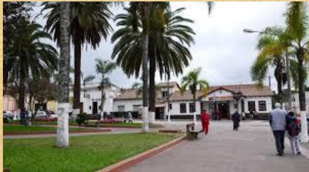
Vista del Edificio Municipal desde la Plaza Domingo Teófilo Pérez

El Carmen es la ciudad cabecera del departamento homónimo en la provincia de Jujuy. La localidad de El Carmen se encuentra a una distancia de 26 km a San Salvador de Jujuy y a una altura de 1.220 m.s.n.m. Se accede por la R.N. N°9.-