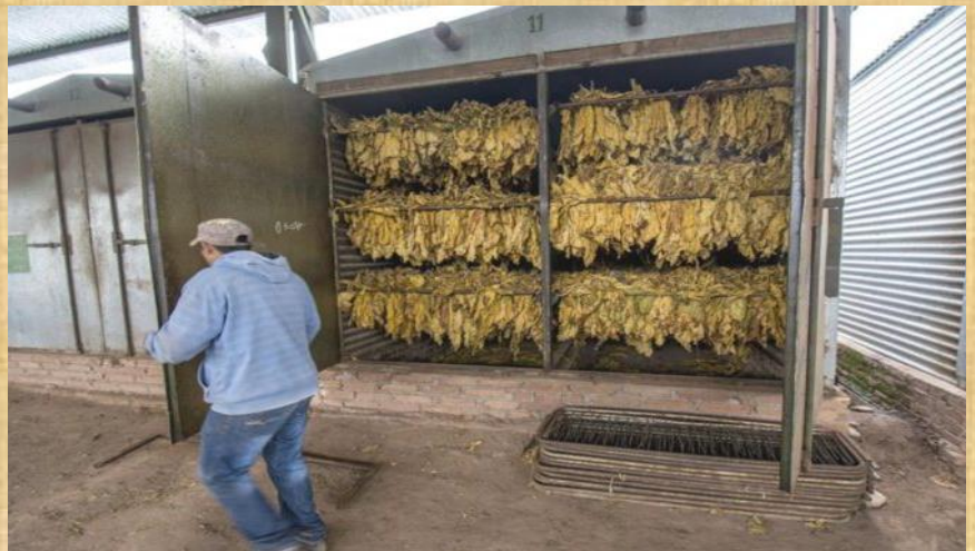
secado en estufa a gas