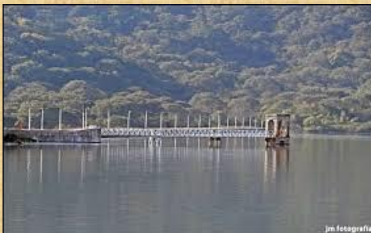
Dique la Ciénaga