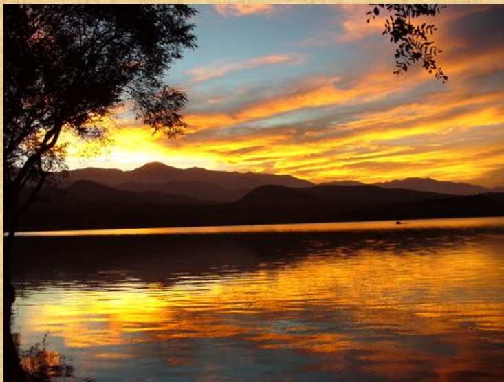
Dique la Ciénaga