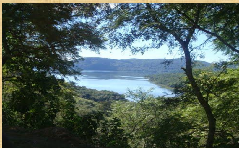
Dique Las Maderas-Vista desde Camino de la Cornisa