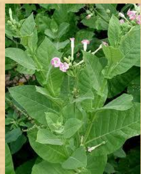
Planta de Tabaco Burley