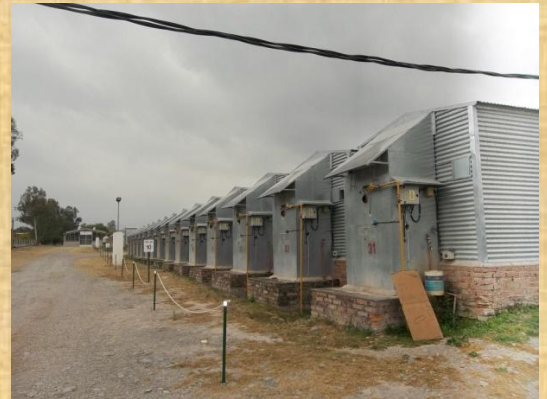
Estufas a gas para el secado del tabaco