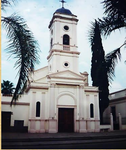
Iglesia de El Carmen

Desde El Carmen a 18 Km por R.N. N° 9 se puede llegar al Abra de Santa Laura con camino de cornisa y a los balnearios Los Naranjos, El Algarrobal y Los Cedros .-