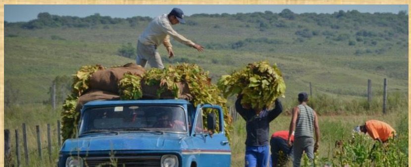
Transporte para su secado