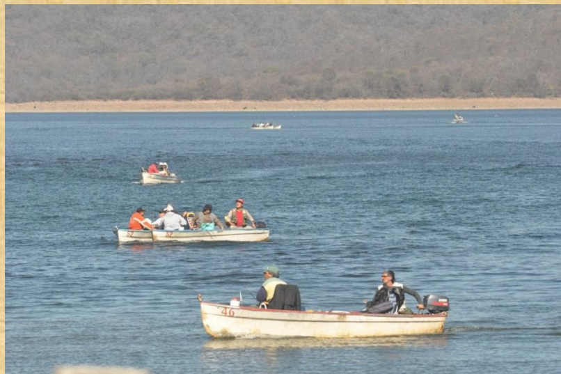
Dique Las Maderas