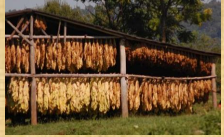
Secado de la hoja de tabaco