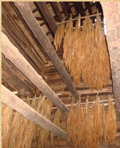
Secado en estufa a leña